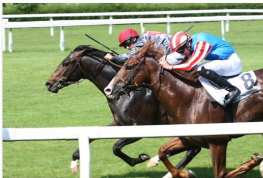
Jaggernaut rimonta e batte Tuttalpiu nella spettacolare volata sui 1200 metri per cavalli di 3 anni