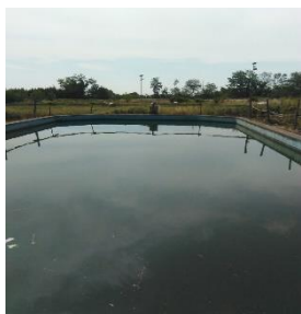
La piscina di scuderia, dove presto sguizzerà anche Elusive.

Elusive sembra essersi rilassata abbastanza ed ora è giunto il momento di rimettersi a lavoro. Così come per Audrey Hepburn, sarà probabilmente un tuffo nella fontana a decretare la fine delle sue (fin troppo lunghe) "Vacanze Romane". Arrivederci in pista bella mia!