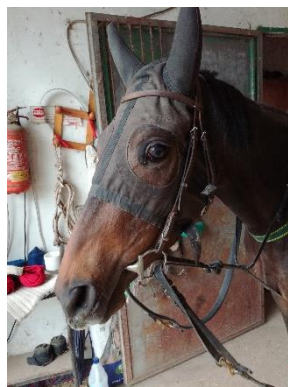
Il suo sguardo malinconico nasconde un cuore di leonessa

all'avambraccio, hanno difatti funestato la cavalla proprio a ridosso del suo rientro in pista (inizialmente previsto per metà maggio). Ad ogni modo, Elusive sembra oramai aver raggiunto una buona condizione fisica e i tempi che macina sulla salita di Anguillara stanno li a dimostrarlo. Con tutti gli scongiuri del caso, ci aspettiamo di vederla presto in pista a Napoli, dove crediamo potrà dimostrare tutto il suo valore.