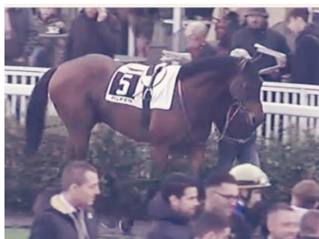
Fico Senza Spine