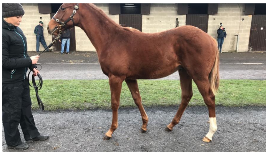
Lot 1357 - Dragon Pulse - Malikhaya (Fasliyev)

Alla fine della storia, sono arrivati in Italia, attualmente in allevamento presso la S.A.B. di Besnate, due maschietti dalle belle speranze; il primo da Power (Oasis Dream) con linea materna da Cape Cross, il secondo da Dragon Pulse (Kyllachy) con mamma Malikhaya (vincitrice di LR e piazzata di GR3) il cui fratellino è il noto Captain Cirdan. Beh...bisogna dire che Perizio ci aveva visto giusto ben prima. Nel giro di 15 giorni dall'acquisto, infatti, il Capitano ha riportato il doppio Goldoni (hp) – Criterium di Pisa (Ir) apportando un ulteriore neretto alla carta materna del Dragon Pulse.